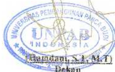
(Bandani, S.T., M.T) Dekan