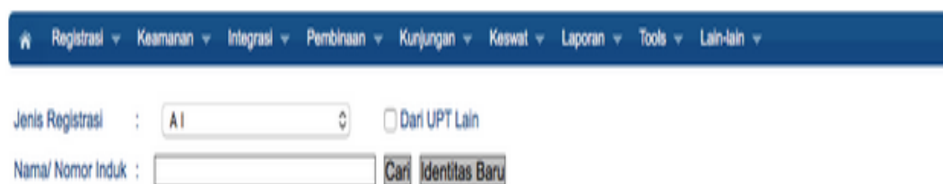
Gambar 13 – Form Registrasi Narapidana Baru

Pada halaman yang muncul berikutnya, Operator diberi dua pilihan metode input data WBP yang akan didaftarkan. Apabila data WBP telah diinput pada halaman Input Penerimaan WBP, ia harus menekan tombol Cari untuk memilih data WBP yang telah diinput sebelumnya. Dan jika WBP belum didaftarkan pada bagian Penerimaan, data-datanya dapat diinput dengan menekan tombol Identitas Baru, lalu menginput data yang bersangkutan pada jendela Manajemen Identitas.