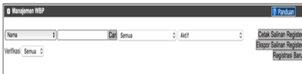
Gambar 12 – Halaman Utama Manajemen Registrasi

Setelah data narapidana dimasukkan ke form Input Penerimaan WBP, maka langkah selanjutnya adalah mendaftarkannya. Pendaftaran narapidana baru juga dilakukan melalui aplikasi SDP Ditjenpas. Setelah login ke aplikasi, operator langsung memilih menu Registrasi – Manajemen WBP – Manajemen Registrasi, lalu akan tampil halaman utama Manajemen Registrasi. Kemudian dilanjutkan dengan menekan tombol Registrasi Baru yang ada pada bagian kanan halaman Manajemen Registrasi, yaitu tombol menu ketiga (paling bawah).